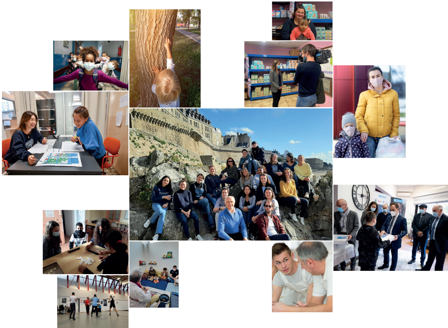
De haut en bas, de gauche à droite : © Littlewolf1989 - stock.adobe.com / © Campus Connecté / © Proxité / © Escalade Entreprises / © Dasha - stock.adobe.com / © Break Poverty Foundation / © EPEPE / © Break Poverty Foundation / © Breck Poverty Foundation / © Auremar - stock.adobe.com / © puhimec - stock.adobe.com / © Break Poverty Foundation